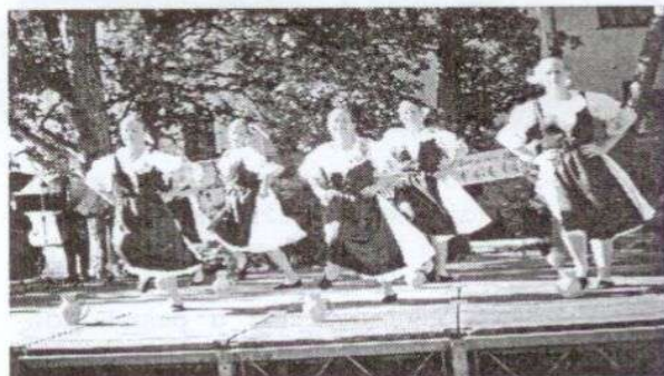
Senecké dievčatá sa rozihrali