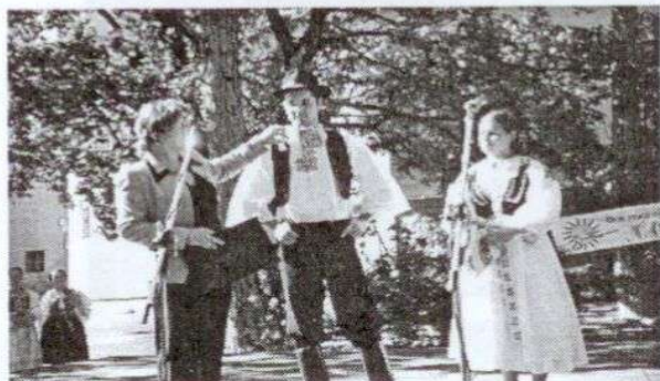
Ukážka krojov z Pezinka.

Novinkou bola predajná výstavka prác detí z tvorivých dielní, ktoré pripravila komunitná nadácia REVIA. Výťažok 1 235,- Sk je príspevkom do fondu REVIE, určeného na aktivity detí a mládeže z regiónu.