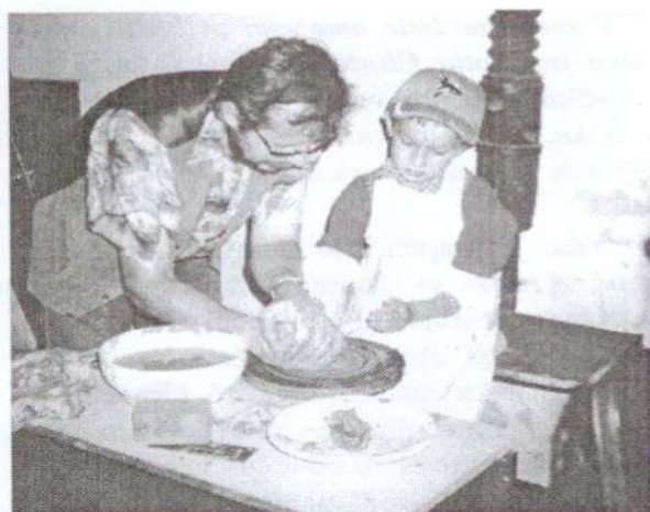
. . . Prvý krát pri hrnčiarskom kruhu . . .

Na záver chcem poďakovať všetkým dobrovoľníkom, ktorí pomáhali pri príprave a realizácii tvorivých dielní a taktiež pri organizácii nedeľného podujatia. Dni malokarpatského folklóru sa uskutočnili aj vďaka finančnej podpore z Fondu kultúry Mesta Pezinok.