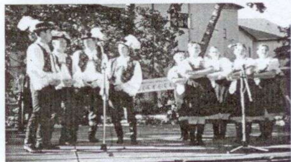
Záver programu patrilo súboru Lipka z Dubovej.