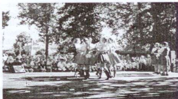
Karička v podaní dievčat z pezinkej ZUŠ-ky