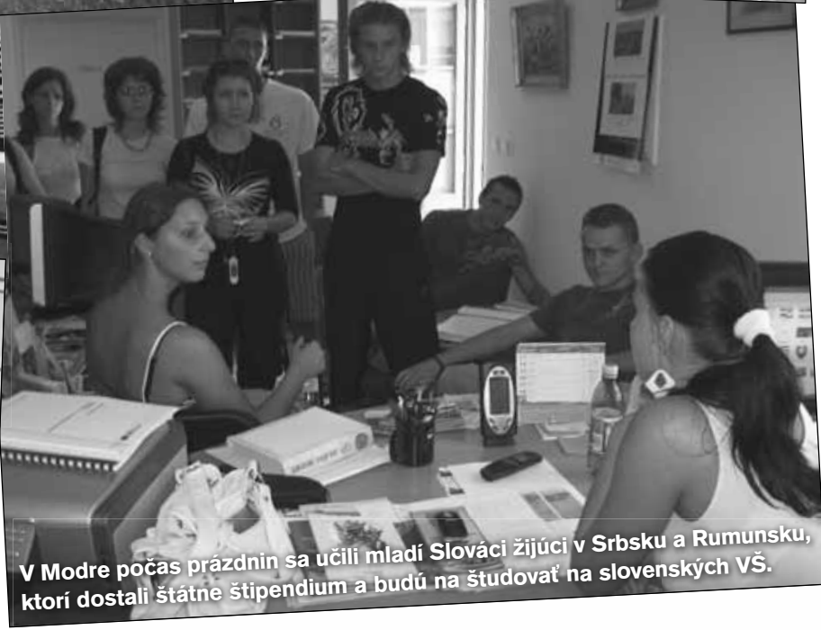
V Modre počas prázdnin sa učili mladí Slováci žijúci v Srbsku a Rumunsku, ktorí dostali štátne štipendium a budú na študovať na slovenských VŠ.