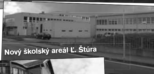
Nový školský areál L. Štúra