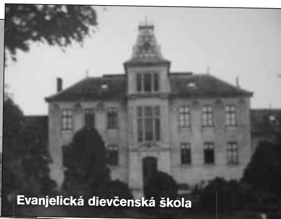
Evanjelická dievčenská škola