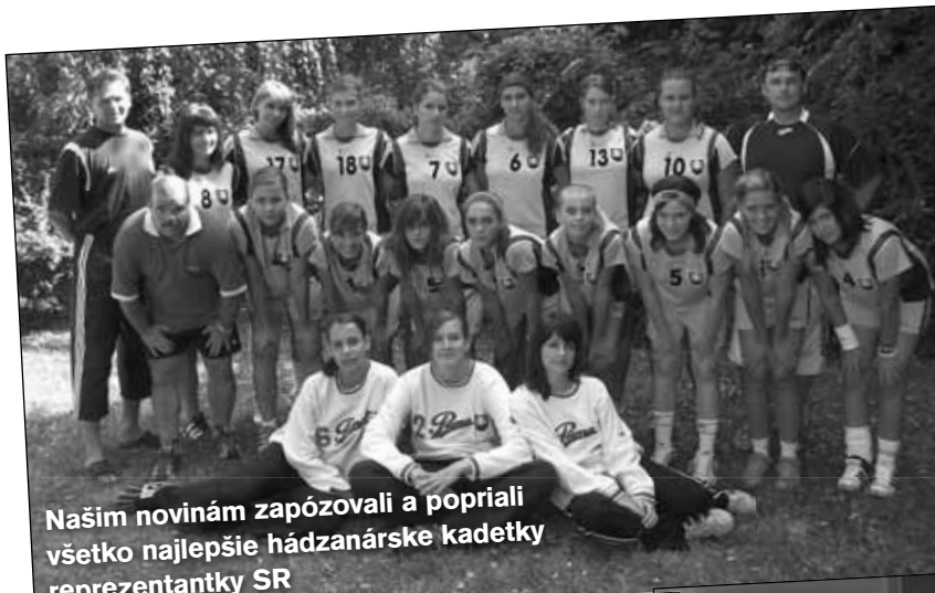
Naším novinám zapózovali a popriali všetko najlepšie hádzanárske kadetky reprezentantky SR