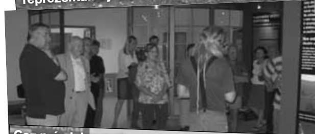
Cez prázdniny mala modranská mládež (i skôr narodení) možnosť navštíviť zdarma expozície SNM v Bratislave, kde ich sprevádzal sám generálny riaditeľ