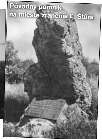
Pôvodný pomník na mieste zranenia L. Štúra